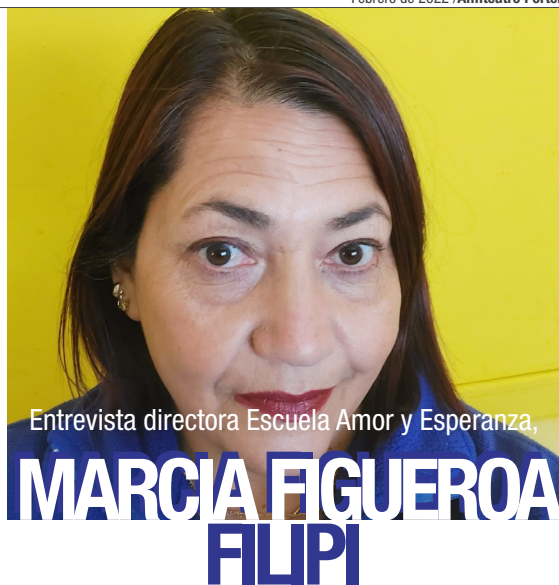
Entrevista directora Escuela Amor y Esperanza,

Nosotras creemos que este es un espacio que es para la comunidad y siempre lo hemos planteado así. Generalmente facilitamos los espacios para que hayan reuniones, de hecho el año pasado tuvimos, en periodo de pandemia, la escuela abierta todo el año. Se hizo una de las ollas comunes del sector y ahora estamos constantemente facilitando este espacio para que se pueda usar. Los niños y niñas que son del sector, si es que necesitan una