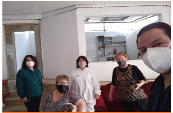
Trabajo en conjunto con el Club Sonrisas y Corazones

Otros proyectos a destacar que se han realizado tienen que ver con talleres de ejercicios físicos y mentales, alarma comunitaria, cursos de musicoterapia, y diversas charlas otorgadas por SENAMA, IPS y la Municipalidad de Valparaíso. De esta forma, la organización y sus participantes se han ido llenando de vida. En conjunto con el CESFAM existe una excelente comunicación y disposición para trabajar, es por ello que se han realizado diversos talleres, charlas y proyectos, donde se destaca, por ejemplo, el programa “Más adultos mayores autovalentes”, donde diversos profesionales asisten a la sede del club a realizar charlas socioeducativas. Por otro lado, se destaca la orientación y ayuda en postulación a proyectos, donde uno pronto a iniciar tiene relación con cocina saludable, el cual lo llevará a cabo una nutricionista profesional del CESFAM. Estas son instancia nuevas para los participantes del Club, pues son pensadas en su salud y en la obtención de nuevas experiencias. También se han creado