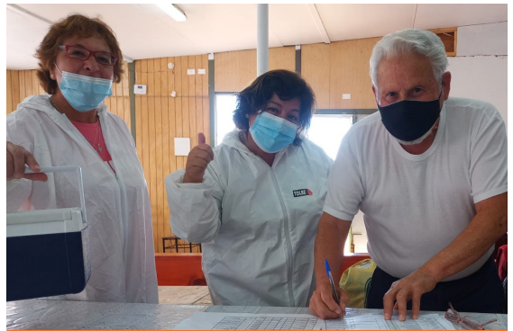
La comunidad en la entrega de medicamentos

lazos entre la organización y el CESFAM, permitiendo que se lleve a cabo la entrega de medicamentos y alimentos para personas mayores de 65 años en la sede del Club.